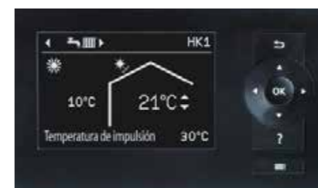
Pantalla de la regulación de la bomba de calor Vitotronic 200